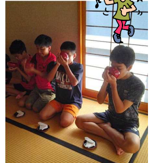
伊江島、民泊体験で楽しかった活動の様子