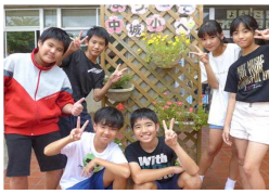
これからも花いっぱいの学校をめざし頑張ります。児童一同

学校の環境づくりに、毎日頑張る栽培委員会の皆さんです。「中城小を花いっぱい」を合い言葉に取り組む素敵なメンバーです