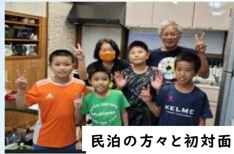
民泊の方々と初対面