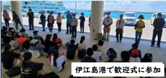
伊江島港で歓迎式に参加