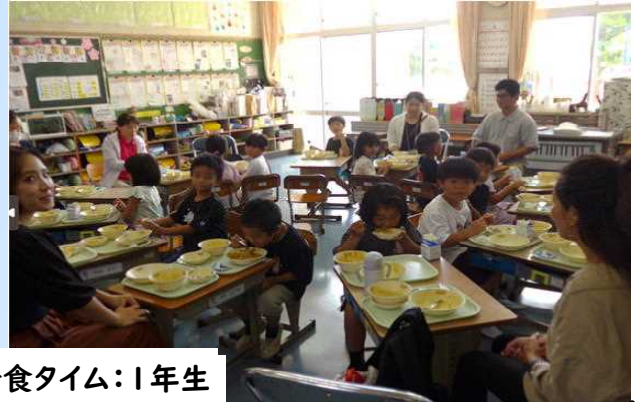
9/13 親子で楽しく給食タイム:1年生