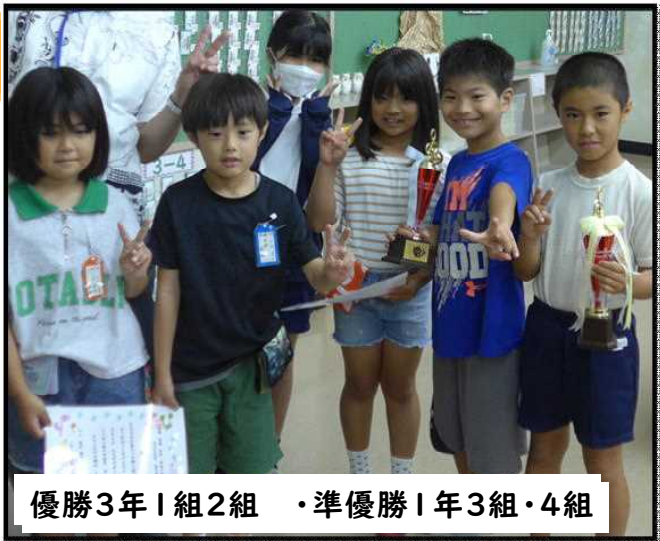
優勝3年1組2組 ・準優勝1年3組・4組