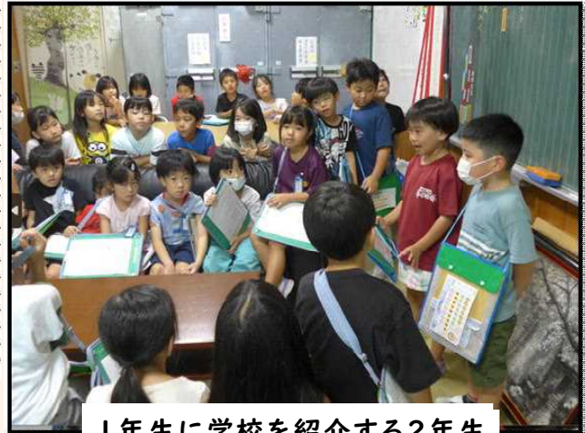
1年生に学校を紹介する2年生