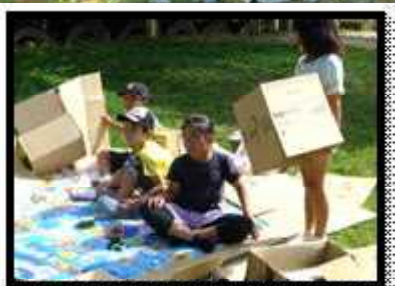
○4年生が図工の時間に、段ボールを使った表現遊びで秘密の部屋づくりを楽しんでいました。