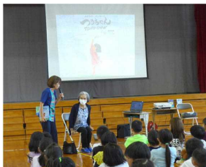
【戦争の怖さを語るつるちゃん】

また、多目的ホールには、子ども達が学習を通して考えた平和へのメッセージを貼るボードも月桃の葉で装飾し準備しています。通路の天井には、平和の象徴である千羽鶴が飛んでいます。さらに、平和に関する講師を招いて、平和集会も開催しています。平和学習を通して、子ども達の心に平和の砦を築いて欲しいと思います。