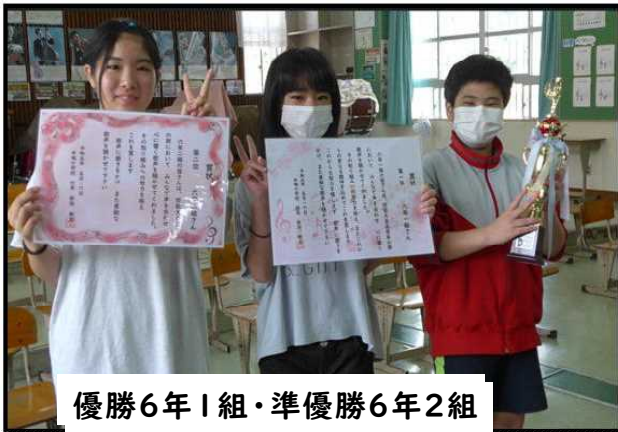
優勝6年1組・準優勝6年2組