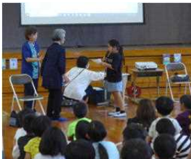
【代表でお礼を述べる三年児童】